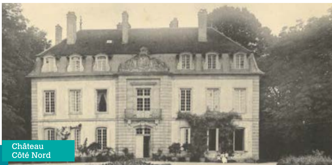
Château Côté Nord