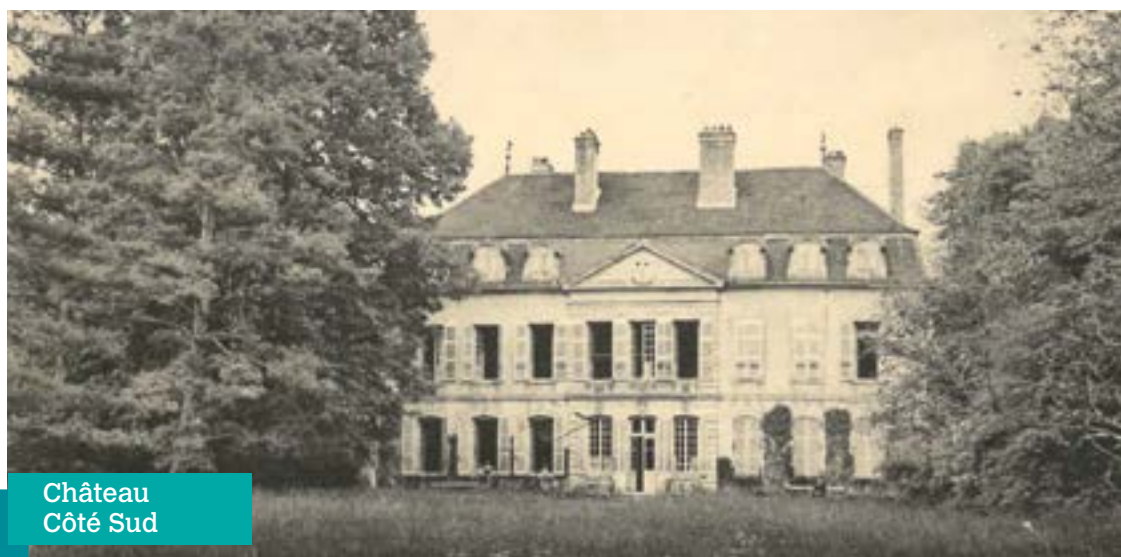
Château Côté Sud